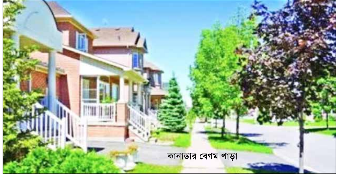
কানাডার বেগম পাড়া

দেশ রিপোর্ট, ৪ অক্টোবর ২০২৪: বাংলাদেশের বিভিন্ন দলের রাজনীতিক, ব্যবসায়ী, আমলা ও প্রভাবশালীদের বড় একটি অংশের রয়েছে দ্বৈত নাগরিকত্ব। দেশের পাশাপাশি তাদের অনেকেই শক্ত খুঁটি গেড়েছেন দেশের বাইরেও। সেখানে গড়েছেন সম্পদের পাহাড়। বিদেশে বসত গড়ার শীর্ষে রয়েছে যুক্তরাজ্য, যুক্তরাষ্ট্র, কানাডা, সিঙ্গাপুর, মালয়েশিয়া ও আরব আমিরাত। বিভিন্ন সময় বিদেশে শীর্ষ